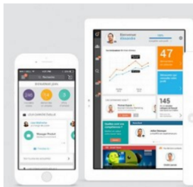
Viadeo enrichit son portfolio avec des services packagés taillés pour les grands comptes, les PME et les TPE.

A la peine, le réseau social professionnel français Viadeo complète ses services avec des offres payantes taillées sur mesure pour les grands groupes ainsi que les TPE/PME qui auront la possibilité de publier leur page web et de diffuser autant d'offres d'emploi qu'elles le souhaitent. Les propositions de stages, encore peu présentes sur la plate-forme, pourront être publiées gratuitement.